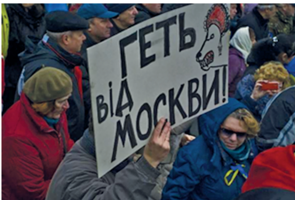
Іл. 2. Учасники маршу 01.12.2013 р.

Ситуація змінилася після розгону мітингувальників уранці 30 листопада 2013 р. Наступного дня, 1 грудня, на протести вийшли сотні тисяч (!) людей. Уже тоді з'явилося кілька плакатів, в яких чітко артикульовано необхідність повного відокремлення від Москви. Зокрема, це плакат «Геть від Москви!» (іл. 2).